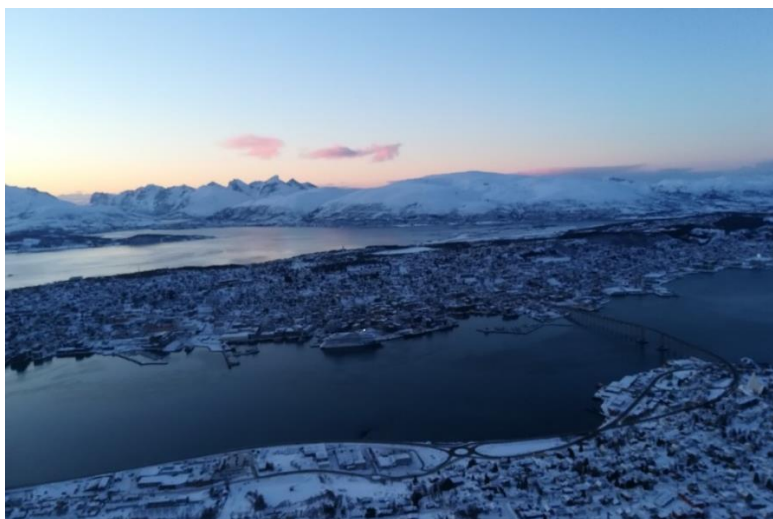
Ett vintrigt Tromsö

Förutom studier och att upptäcka Oslo med omnejd hann vi resa runt till bl.a. Bergen, Stavanger och Tromsö – och för en naturälskare är städer som dessa fantastiska resmål. Norge är så otroligt vackert och har så mycket att erbjuda. Bl.a. besteg vi berg, gick i världens längsta trätrappa samt en tur med hundsläde i norrskenet. Något av det jag är mest glad över är att vi tog chansen och reste runt inom landets gränser under utbytets gång.