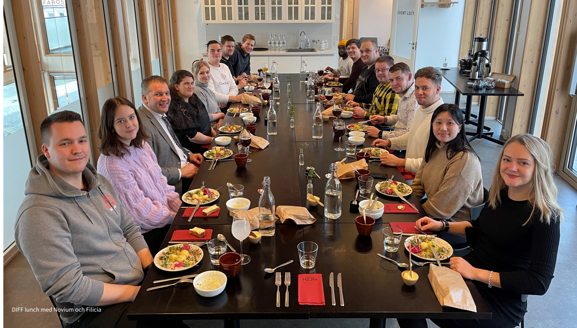
DIFF lunch med Novium och Filicia