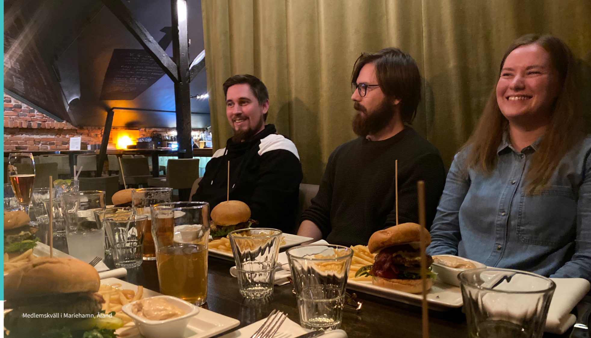
Medlemskväll i Mariehamn, Åland

I de gemensamma utskotten med TFIF aktiverade DIFF nya medlemmar och även personalen tog del av utskottens möten.