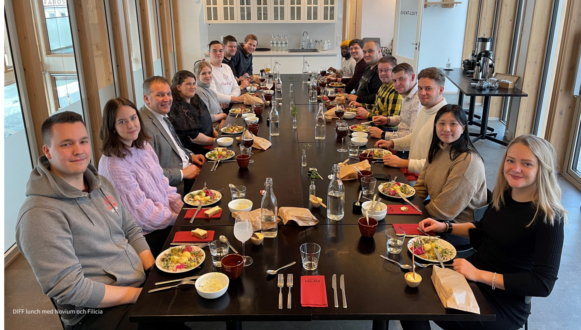
DIFF lunch med Novium och Filicia