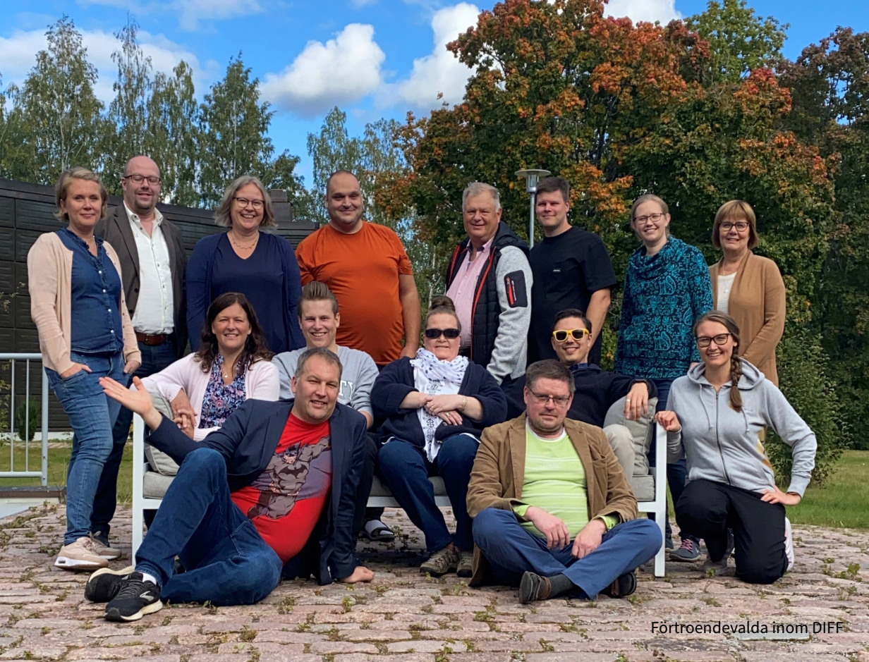
Förtroendevalda inom DIFF