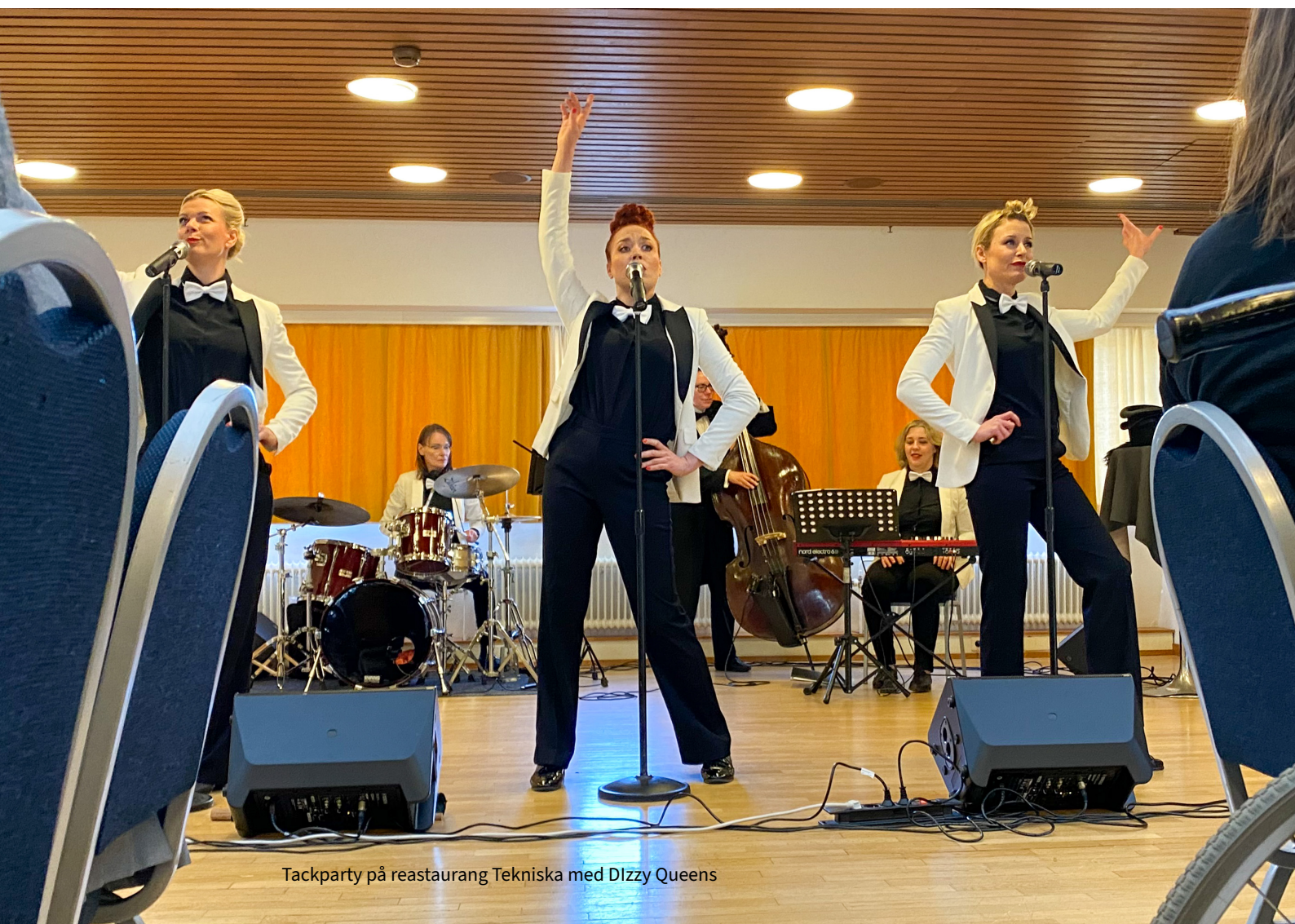
Tackparty på restaurang Tekniska med Dizzy Queens

I november ordnades ett besök till Befolkningskyddsmuseet.